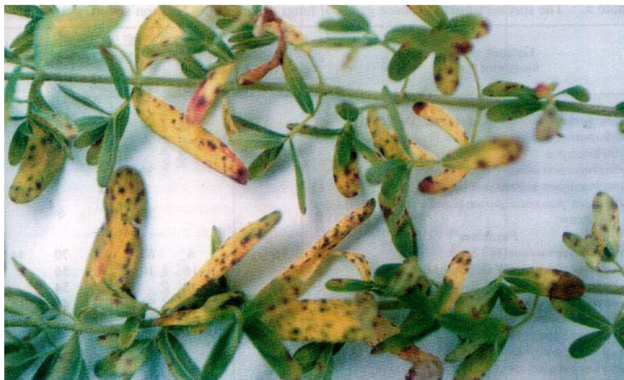
Fot. 3. Czerwono-bursztynowe nekrotyczne plamy na liściach dziurawca zwyczajnego powodowane przez Seimatosporium hypericinum