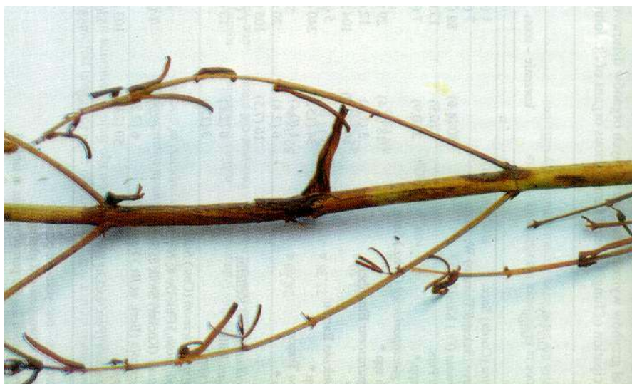
Fot. 2. Nekroza i pękanie kory łodygi dwuletnich roślin dziurawca zwyczajnego powodowane przez Seimatosporium hypericinum Phot. 2. Necrosis and cracks in the bark of stems of two-year-old St. John's wort plants caused by Seimatosporium hypericinum