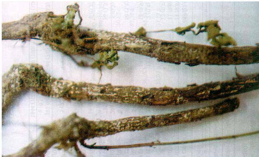
Fot. 1. Fusarium spp. na łodygach dwuletnich roślin dziurawca zwyczajnego Phot. 1. Fusarium spp. on the stems of two-year-old plants of St. John's wort